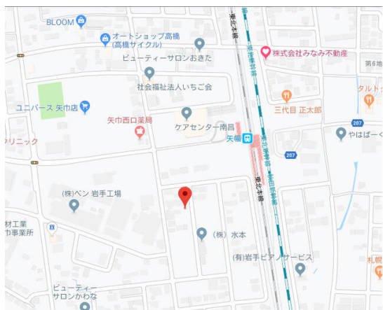
南矢幅第6地割駐車場 配置図(概要)